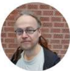
Collin Full body workout