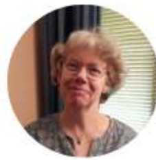
Corla Internationale dansen