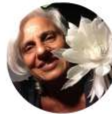
Gülnar Yoga Sport & Spel