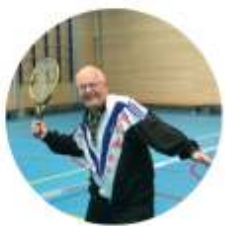
Frank Dynamic Tennis Sport & Spel