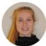
Tessa Sportmix jeugd