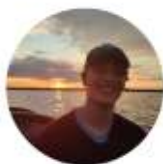
Freek Freerunning jeugd