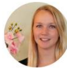
Linda Dance workout Full body workout