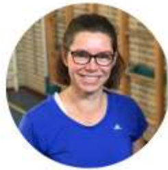
Sascha Sport & Spel