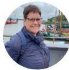
Esther Internationale dansen