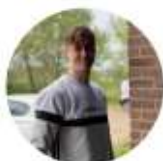
Bram Basketbal jeugd