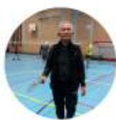
Chyco Badminton jeugd & volwassenen

N.B.: We hebben niet van alle sportleiders een foto.